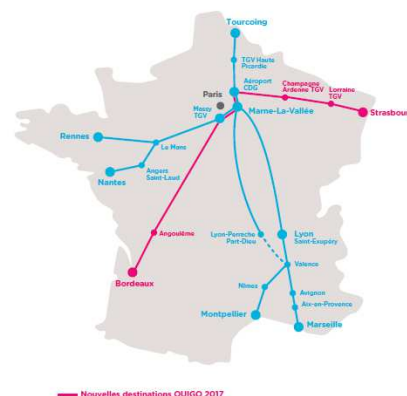
— Nouvelles destinations OUIGO 2017

Ainsi, c'est plus de 2 millions de places offertes pour voyager à petits prix sur Rennes, Bordeaux et Nantes, au second semestre 2017.