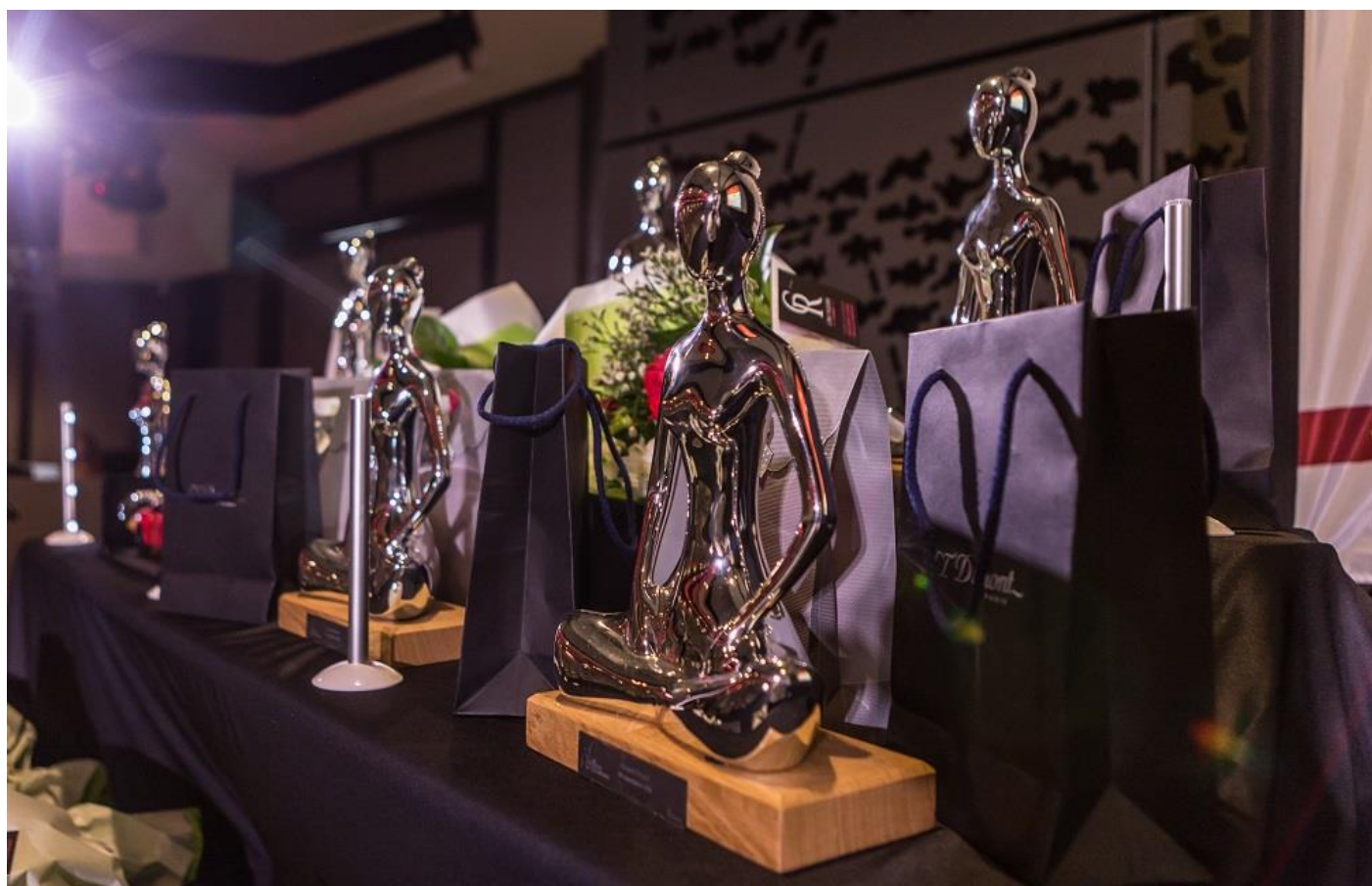
La table des dotations des lauréates et les Trophées.

Dominique Mouillot - Présidente d'Onet Technologies