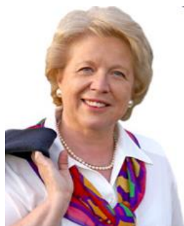
Grand Est Marie-Jo Zimmermann Députée de Moselle & co-auteur De la loi Copé-Zimmermann