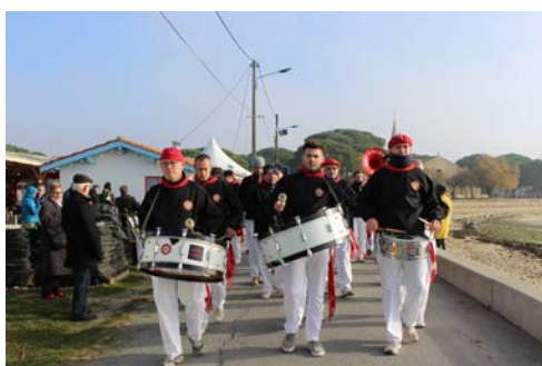
Los Calientes