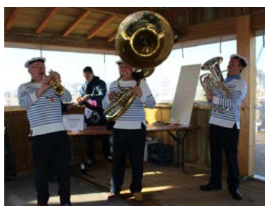
Et Vogue la Galère – Chants marins traditionnels