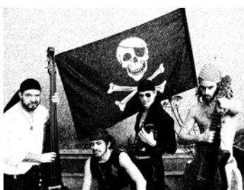
Les Pirates Chants et musiques énergiques, groupe issu de la compagnie des Branques...