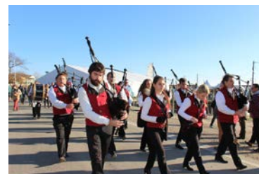
Bagad Ker Vourdel- Musique, marche, traditionnelles bretonnes