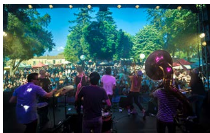
Get 7 Brass Band Fanfare cuivrée aux influences New Orleans et funky- ©Tom Chevé/ RedsKprod