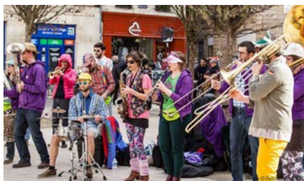
La Grasse Bande « Jeune fanfare du vieux Bordeaux » Disco Btp Distinction...