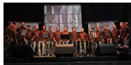
Los de Broussez- Chants occitans et espagnols