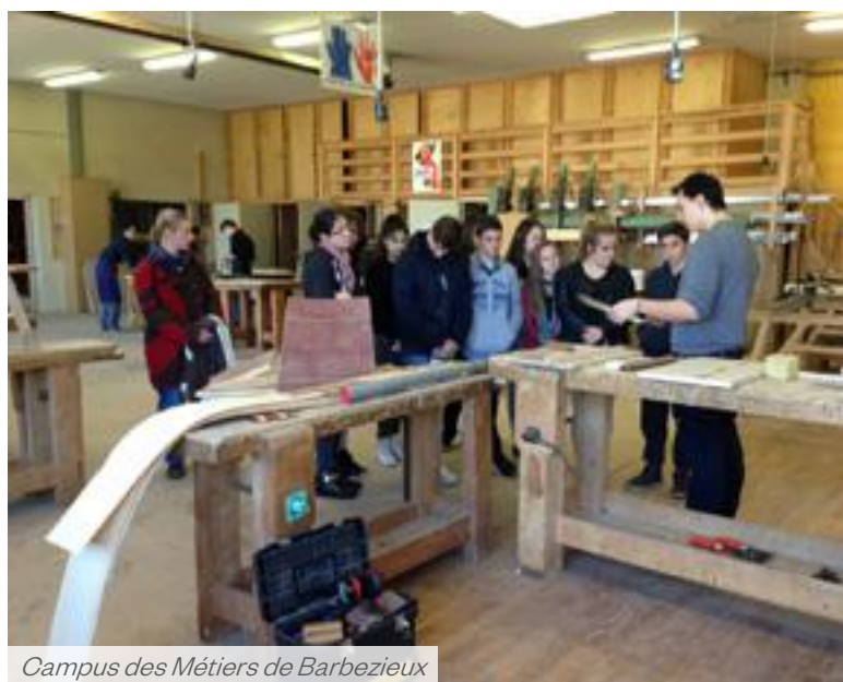
Campus des Métiers de Barbezieux