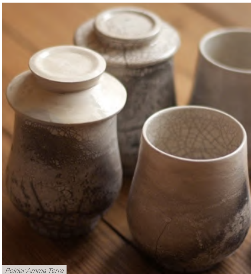
Poirier Amma Terre

LES JOURNÉES EUROPÉENNES DES MÉTIERS D'ART SONT COORDONNÉES PAR