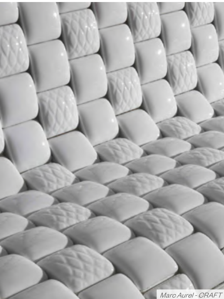
Marc Aurel - CRAFT

Inscriptions : contact@craft-limoges.org