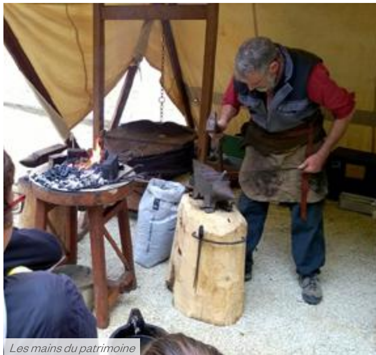
Les mains du patrimoine