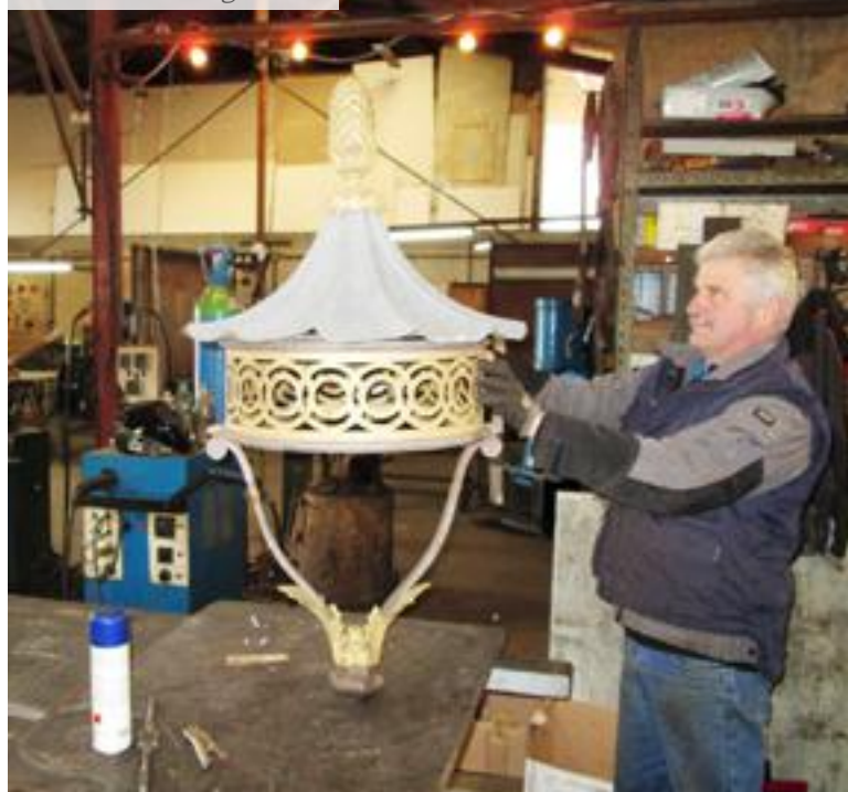
Ferronnerie d'Art gâtinaise