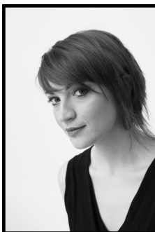
Cécile Lohmuller Soprano