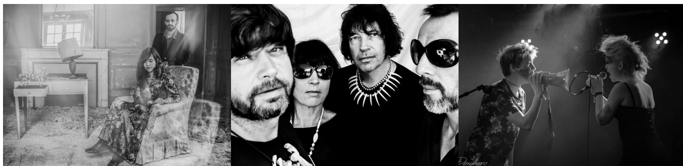
De gauche à droite : Queen of the Meadow, The Wylde Tryfles et Pointpointvirgule.

Les groupes à l'affiche : Ad Patres, Wizard, The Wylde Tryfles, Big Meufs, Thrilllogy, Queen of the Meadow, Daisy Mortem, Pointpointvirgule, Toms, Little Jimi, Ulrich, Bizmiz, Yyellow, CouRtney & the Wolves, Iron Flesh, Presqu'île, Colision, Aya, Atomic Mecanic, Doktor Avalanche, Clara et les chic freaks et Cosmopaark.