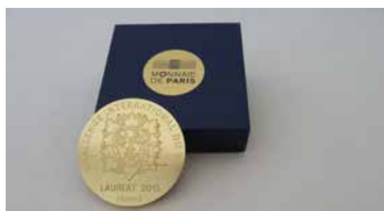
Médaille frappée de la Monnaie de Paris