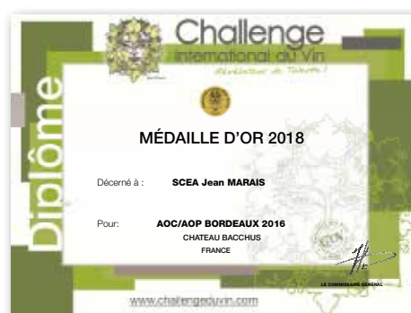
Diplôme officiel du Concours