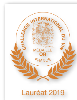
Plaque plexiglas lauréat