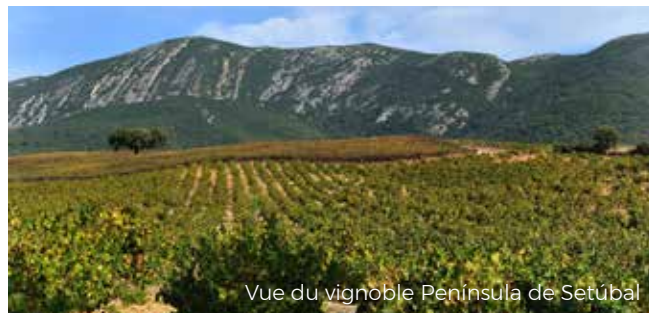
Vue du vignoble Península de Setúbal