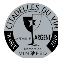
Médailles adhésives reconnues dans le monde entier