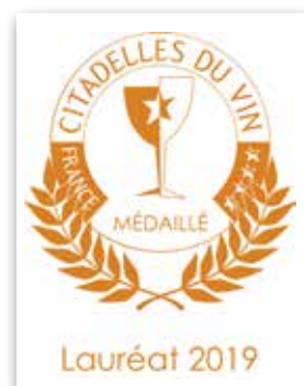
Plaque plexiglas lauréat