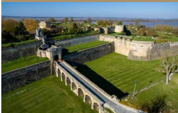
Citadelle de Blaye

Le concours Citadelles du Vin porte ce nom en hommage aux nobles citadelles de Blaye et de Bourg qui font partie du patrimoine régional aquitain.