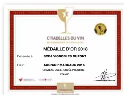
Diplôme officiel du Concours