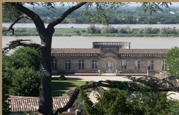
Citadelle de Bourg