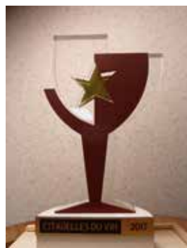
Trophée Citadelles du Vin