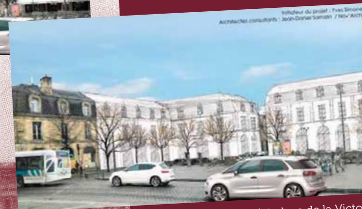
Projet place de la Victoire