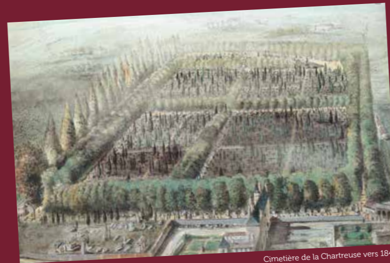
Cimetière de la Chartreuse vers 1840

Parmi les nouvelles plantations, favoriser entre autres, l'Acer Campestris (érable champêtre) qui pousse à 12 m maximum. Il serait respectueux de l'environnement minéral de Bordeaux.