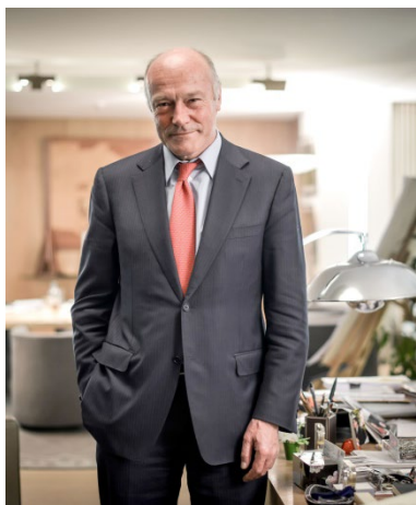
Alain Rousset, Président du Conseil régional de Nouvelle-Aquitaine