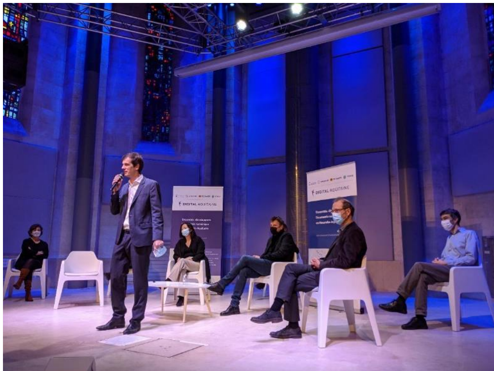
Introduction à l'Agora