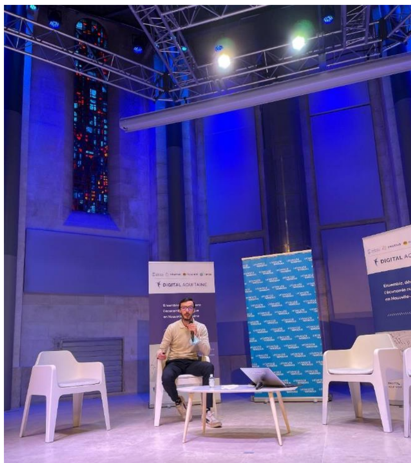
Winspace à l'Agora