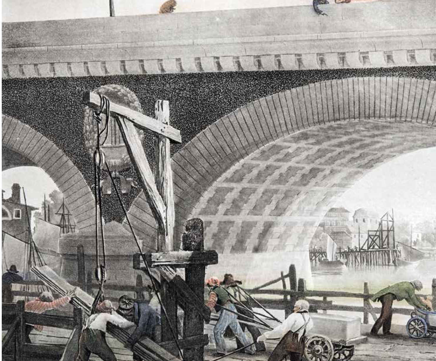
> Vue de La Bastide, Louis Garneray, c. 1822. © Archives de Bordeaux Métropole, Bordeaux IX R 363