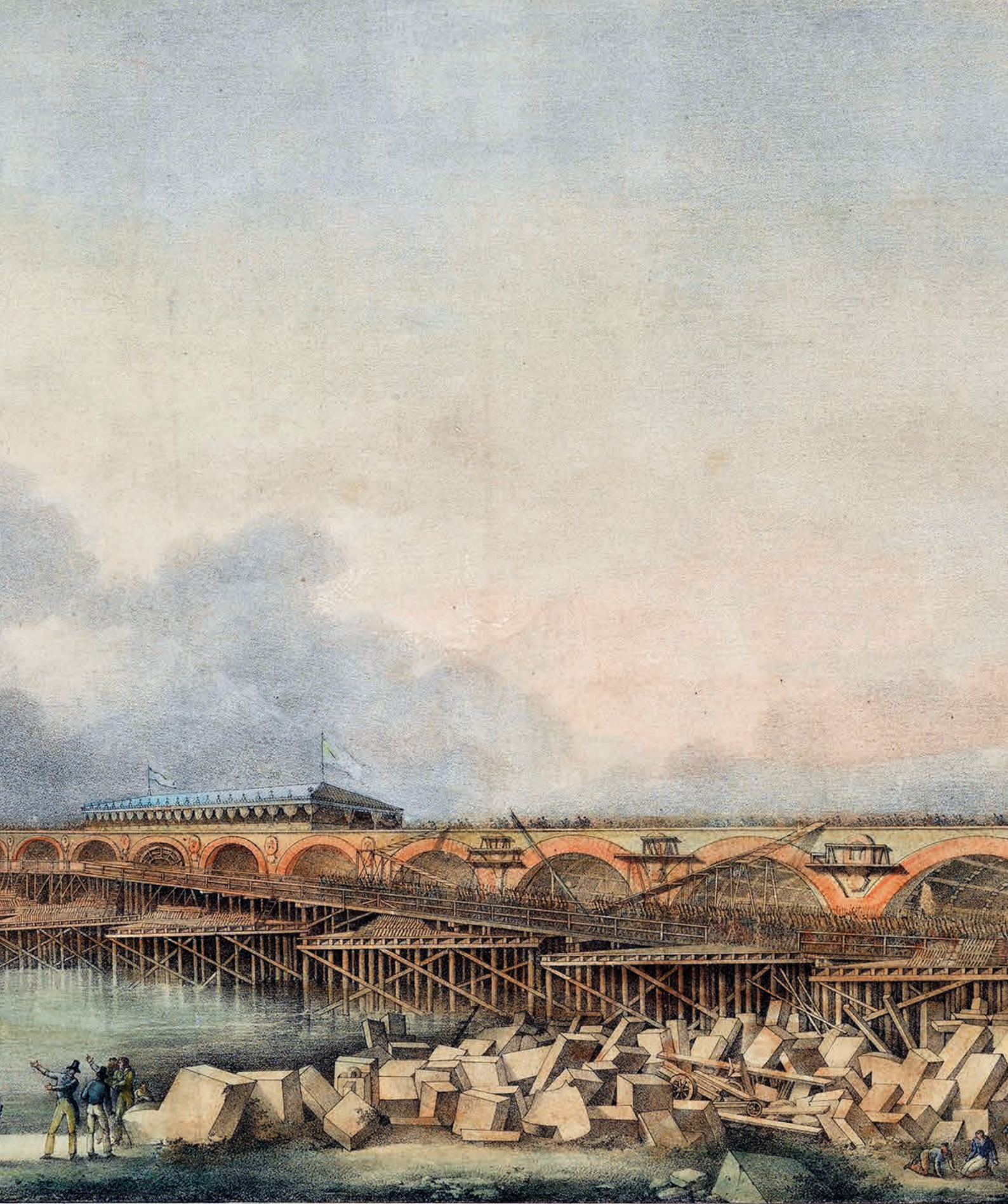
Vue de la fête donnée le 25 août 1821, jour de St Louis, pour la pose de la dernière pierre des voûtes du pont de Bordeaux.