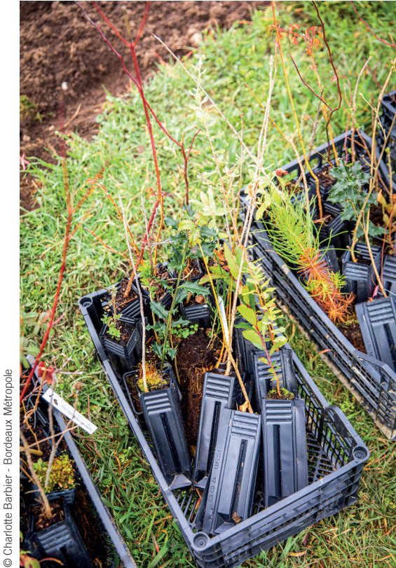
© Charlotte Barbier - Bordeaux Métropole