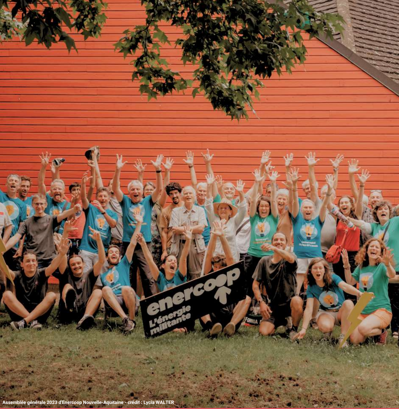
Assemblée générale 2023 d'Enercoop Nouvelle-Aquitaine